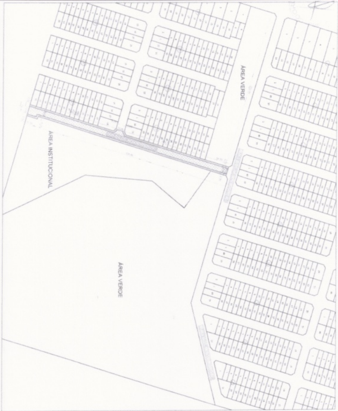
MAPA 02 - VIAS LOTEAMENTO MONTENEGRO II