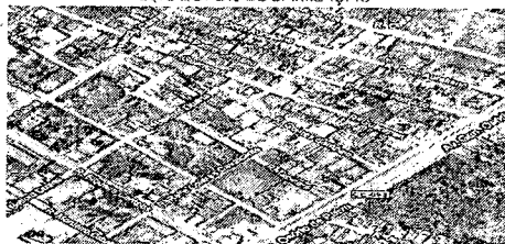
ANEXO ÚNICO CROQUI DE LOCALIZAÇÃO