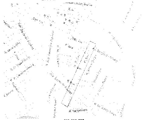
ANEXO ÚNICO CROQUI DE LOCALIZAÇÃO

DECRETO LEGISLATIVO Nº 388 DE 08 DE SETEMBRO DE 2009