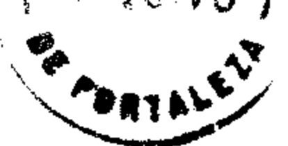
TABELA DA CAMARA MUNICIPAL DE FORTALEZA = PARA TRANSPORTE COLETIVO