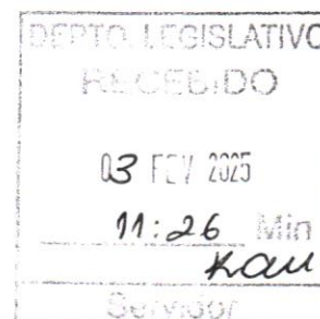
Bella Carmelo (PARTIDO LIBERAL)