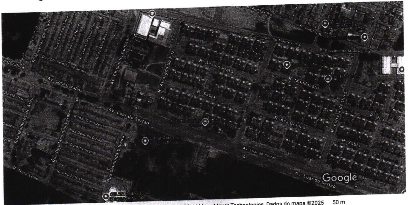
50 m