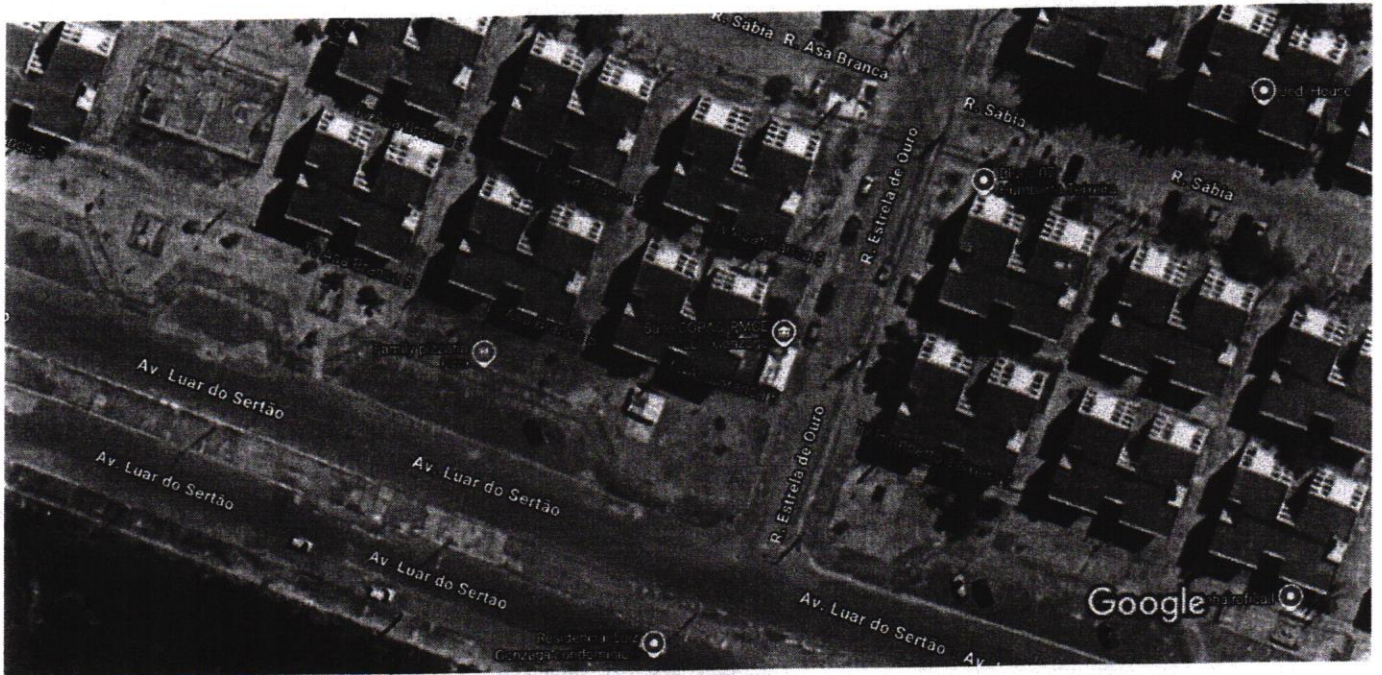
Imagens ©2025 Airbus, Maxar Technologies, Dados do mapa ©2025 10 m