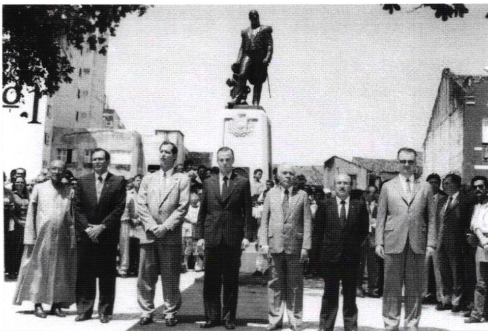
(3) Ao lado do então Governador Cícero Costa e do Prefeito Juraci Magalhães na reinauguração da praça Dom Pedro II, em 1991.