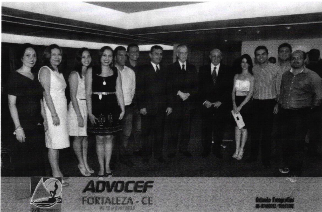
(8) Homenagem da Associação Nacional dos Advogados da Caixa Econômica Federal (2012)