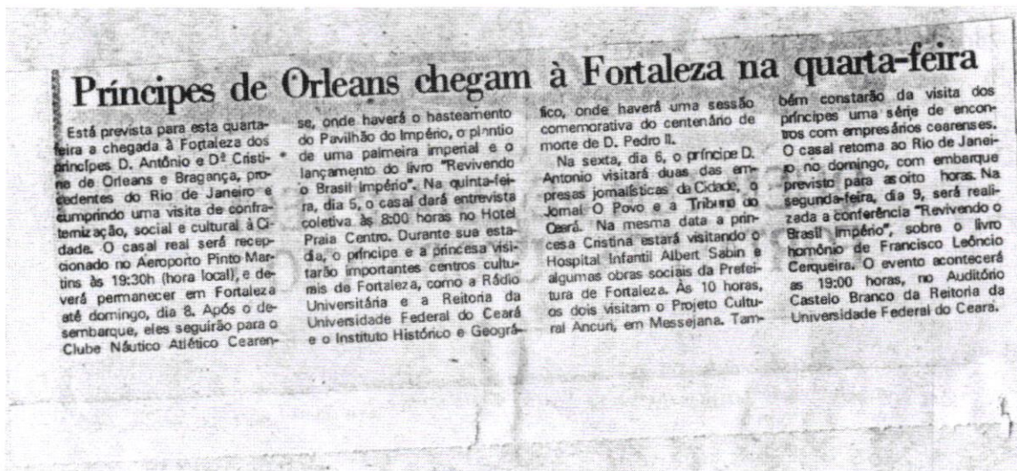
(4) Recortes de jornais noticiando a visita de Dom Bertrand em 1991.