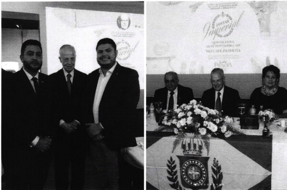
(10) Jantar de homenagem e entrega da Medalha Benfeitor Humanitário da Cruz Vermelha do Brasil (2018)