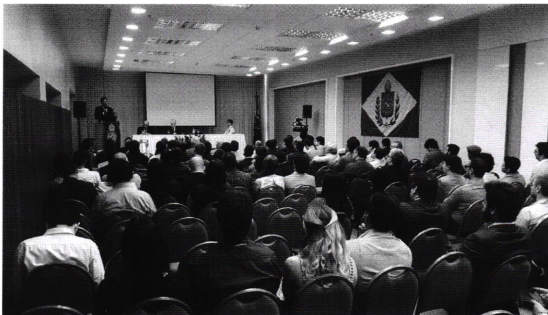
(9) Conferência proferida em evento realizado no Seara Praia Hotel (2015)