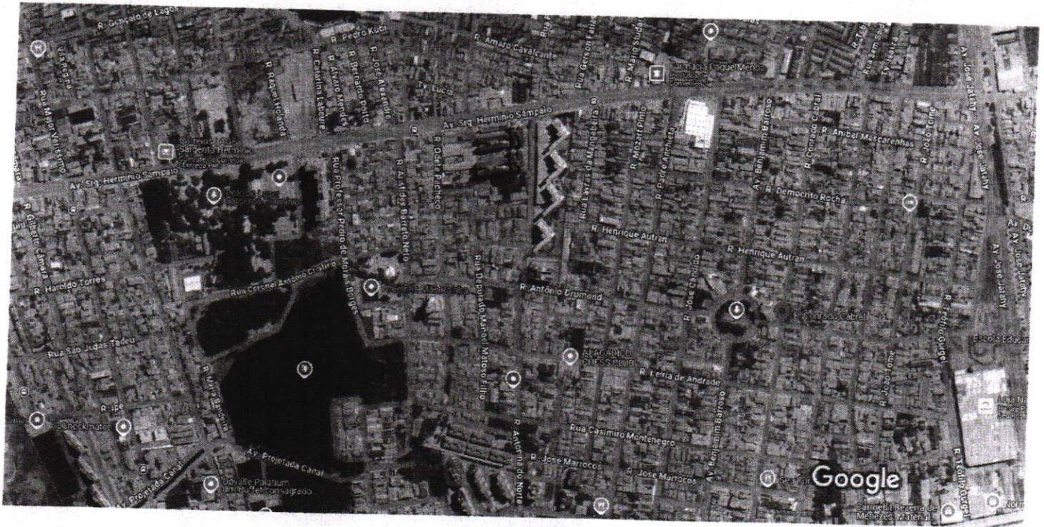
Dados do mapa ©2025, Dados do mapa ©2025 100 m