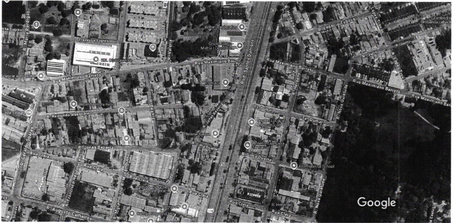
Imagens ©2025 Airbus, Maxar Technologies, Dados do mapa ©2025 50 m