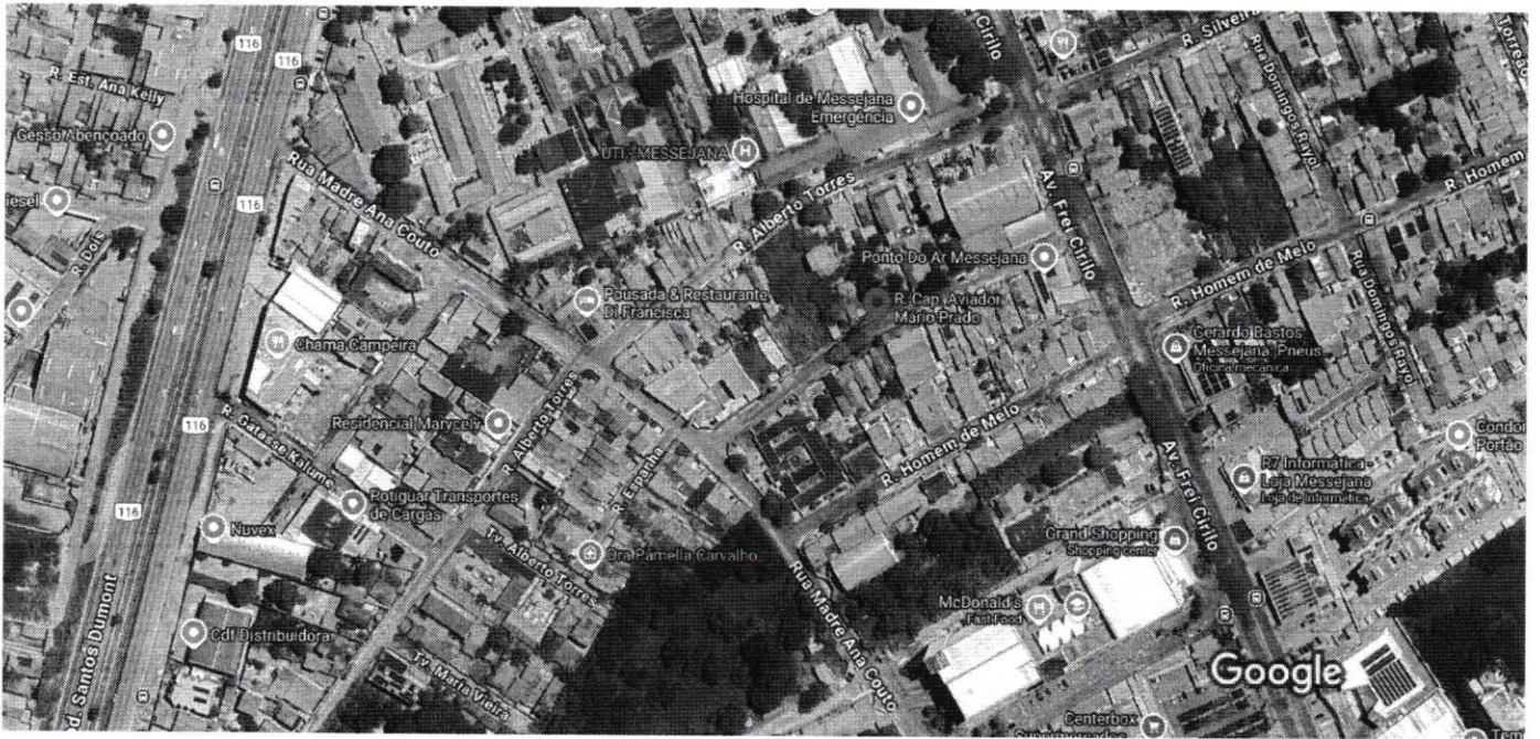
Imagens ©2025 Airbus, Maxar Technologies, Dados do mapa ©2025 50 m