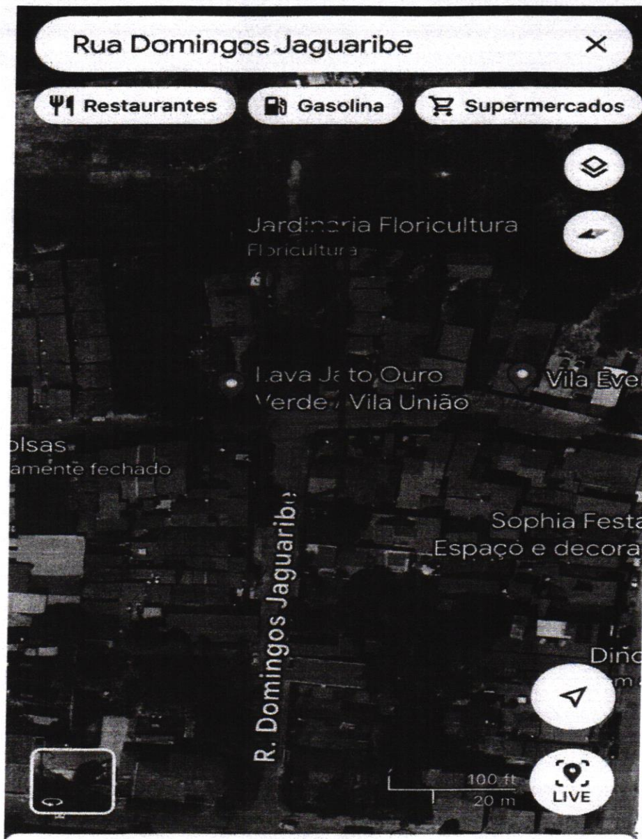
R. Domingos Jaguaribe - Vila União

Asfalto do trecho na Rua Domingos Jaguaribe, conforme foto em anexo, localizada no Bairro Vila União.