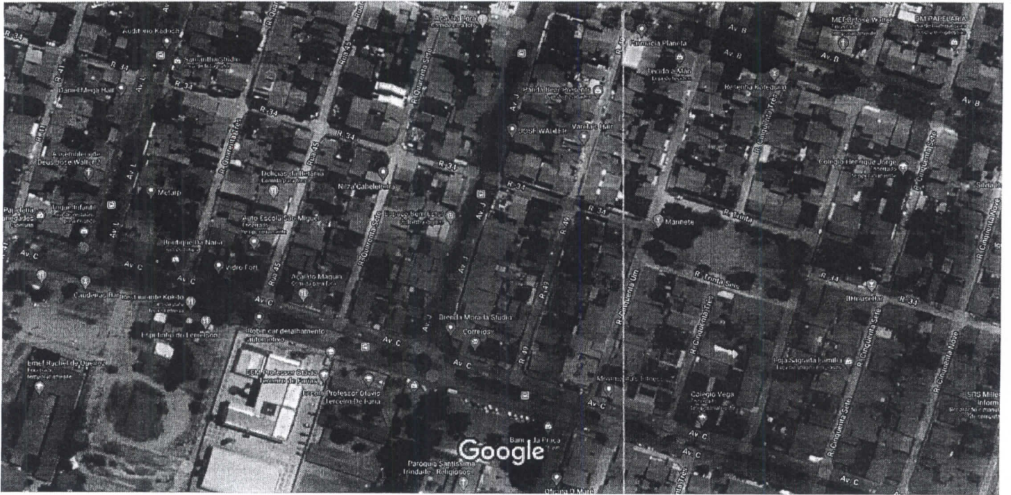
Dados do mapa ©2020 ,Dados do mapa ©2020 20 m

RUA 34 entre a AV. B e a RUA 51 2º etapa com José Walter