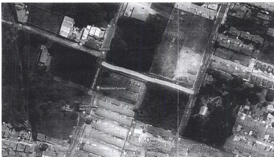
Figura 1: IMPLANTAÇÃO DE CALÇAMENTO - RUA DOS MANDACARUS ENTRE A RUA JOAQUIM MARTINS E A RUA DOS JATOBÁS – BAIRRO PASSARÉ