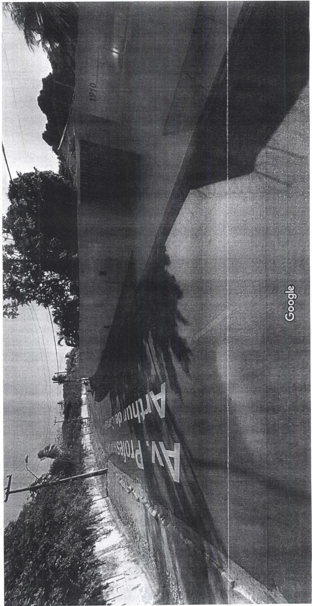
Captura da imagem: ago. 2019