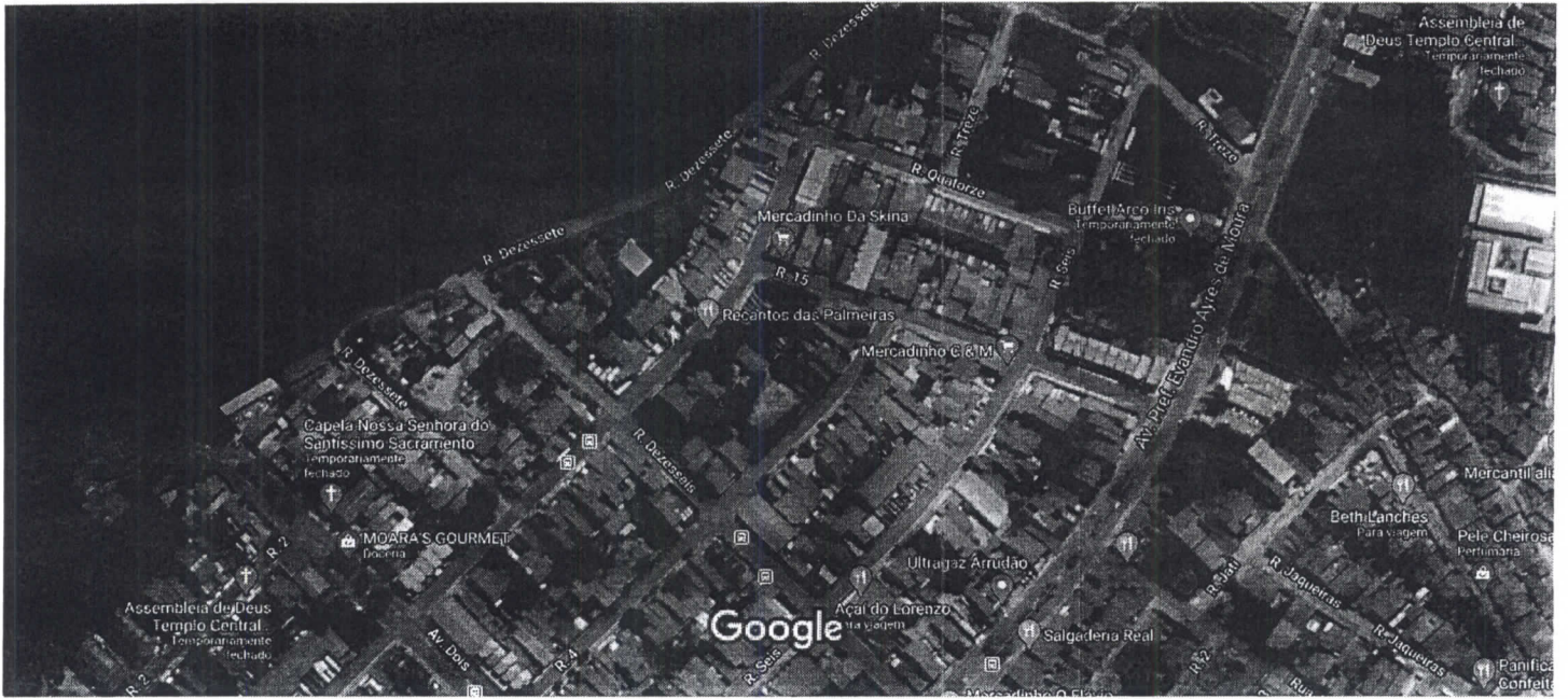
50 m