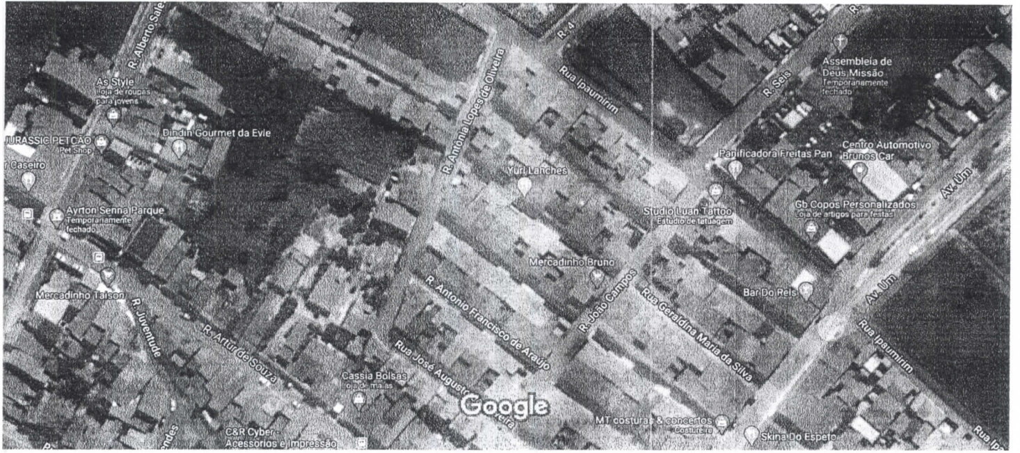
Imagens ©2020 CNES / Airbus, Maxar Technologies, Dados do mapa ©2020 20 m