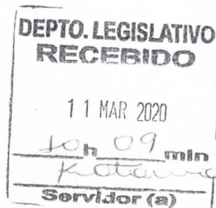
Frota Cavalcante Vereador - PODEMOS

GABINETE DO VEREADOR FROTA CAVALCANTE - PODEMOS