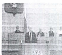
Rússia: Vladimir Putin tentará ficar no poder até 2036