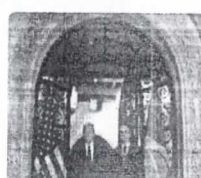
Em evento esvaziado nos EUA, Bolsonaro nega crise e diz que 'problemas na Bolsa acontecem'