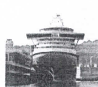
Coronavírus: passageiros de navio desembarcam em São Francisco