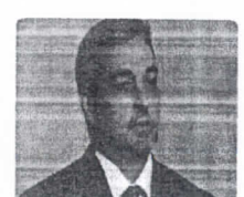
Presidente paraguaio pede investigação de caso Ronaldinho 'cala quem cal'

WP Inc. e seus afiliados. Powered By: XYZ