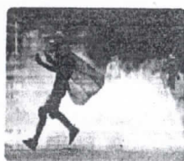
Polícia usa gás para dispersar marcha contra Maduro