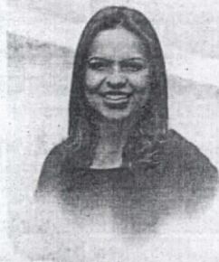
Elba Aquino Editora