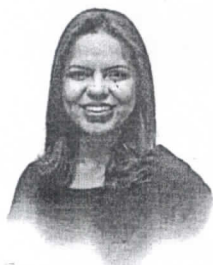
Elba Aquino Editora