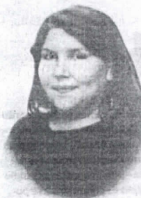
Karine Zaranza Editora