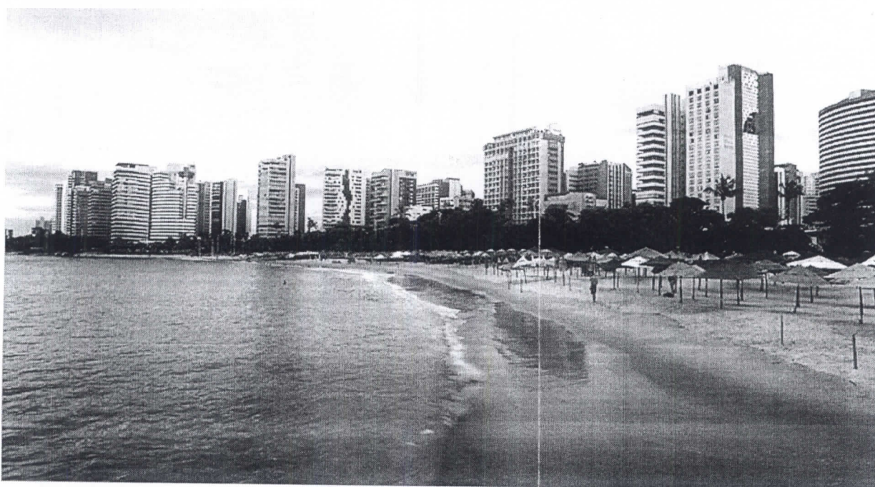
Praia de Iracema

Os quatro postos avaliados pelo órgão estão localizados nas regiões Centro, Leste e Oeste