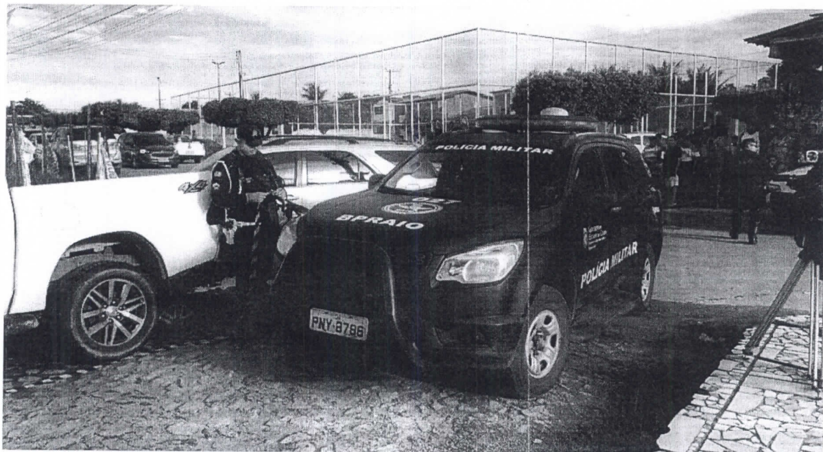
Policial encontrado morto em Pacatuba