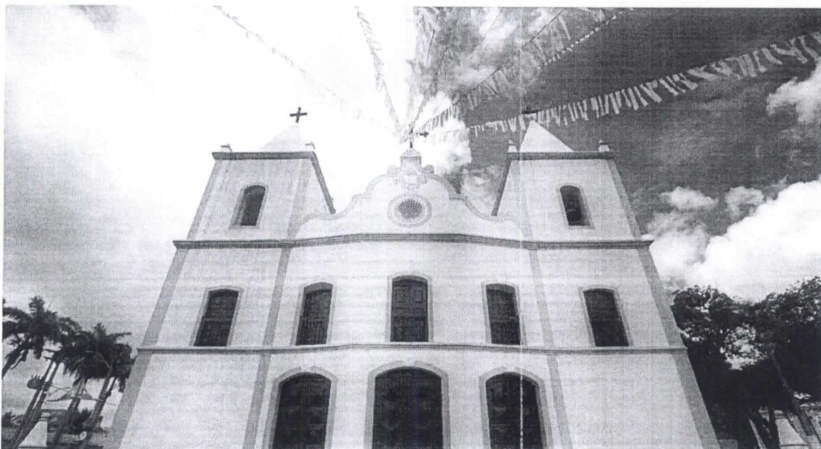
A Igreja Matriz São José de Ribamar é um dos bens tombados pelo Governo do Estado na cidade de Aquiraz, a primeira vila do Ceará criada no ano de 1699

Cidades da Região Metropolitana, que eram vilas no século XVIII, abrigam muitas riquezas patrimoniais. Mas os processos de tombamentos são poucos. O desenvolvimento urbano acelerado interfere na garantia da preservação