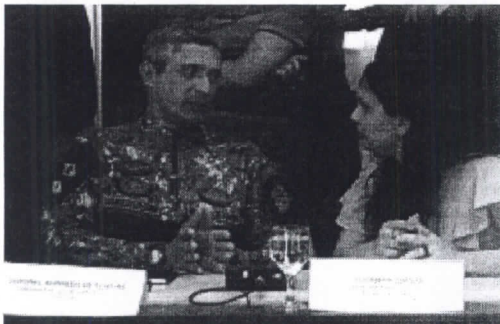
Comissão com representantes dos Três Poderes e das Forças Armadas avalia medidas impostas em 1964 e revota o plebiscito de 1994.

Comissão com membros dos Poderes Executivo, Legislativo e Judiciário do Ceará colheu nesta sexta-feira, 26, que movimento de generalizações dos policiais militares apresente uma "proposta factiva" para a solução do impasse de reivindicações da categoria.