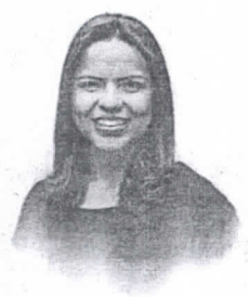
Elba Aquino Editora