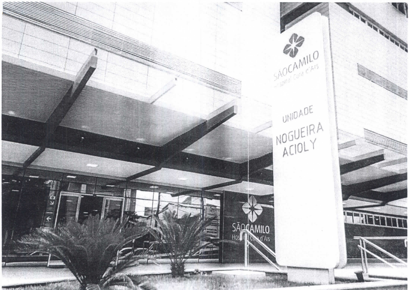
Hospital São Camilo Fortaleza tem hoje 250 leitos

No dia 27 de fevereiro, o Hospital São Camilo Fortaleza completa 48 anos. Desde que se iniciou com a área obstétrica, outras atividades de atração e especialidades como neurologia, pediatria, ortopedia e traumatologia e após 10 anos, foram acrescentadas ao decorrer do tempo, além de ter um centro cirúrgico e Unidade de Terapia Intensiva (UTI) com equipamentos modernos.