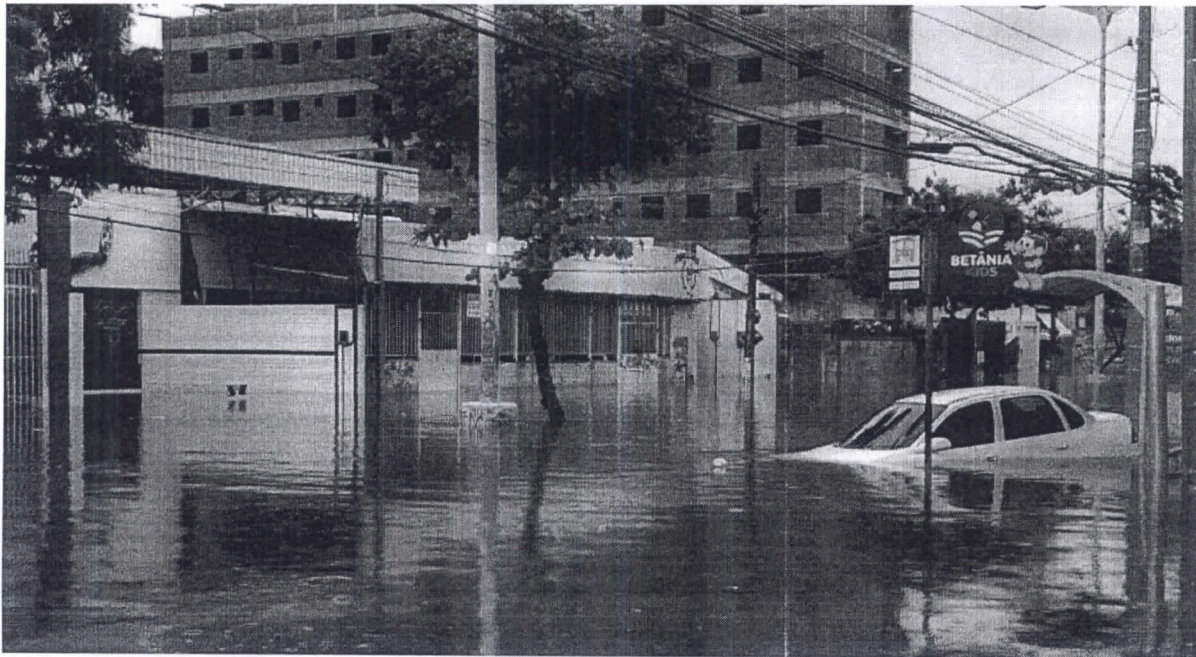
Carro submerso na Avenida Heráclito Graça, no Centro de Fortaleza.

O Instituto Nacional de Meteorologia (Inmet) emitiu um alerta de chuvas intensas em todo o Ceará