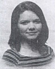
Lorena Cardoso Editora