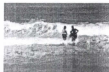
17 praias estão impróprias para banho

O banhista que mora ou está de visita em Fortaleza deve consultar o boletim das praias, antes de programar o banho de mar do fim de semana. A recomendação da Superintendência Estadual do Meio Ambiente (Semace) acompanha o boletim semanal de balneabilidade divulgado nesta sexta-feira (7).