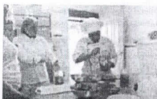
As mães também ganham curso de empreendedorismo

Alimentos descartados por supermercados podem virar doces, geleias, farinhas e muitas outras coisas. É essa a lição que um curso está ensinando para mães de pacientes atendidos pelo Instituto da Primeira Infância (Iprede).