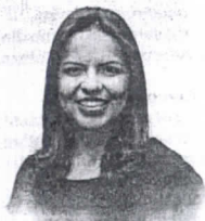
Elba Aquino Editora