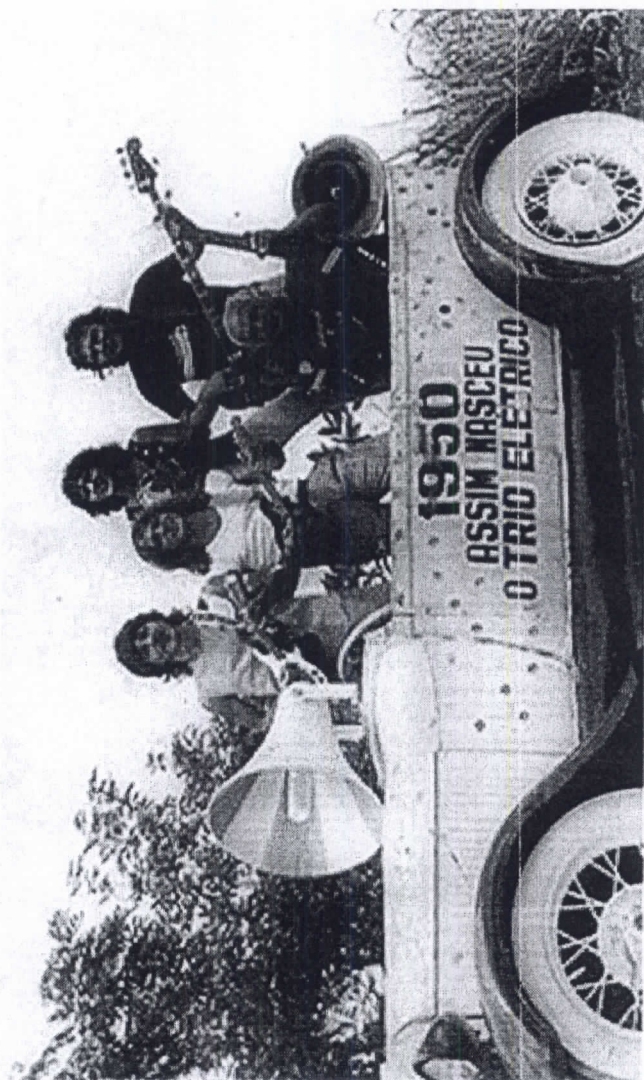
O FORD DE 1929