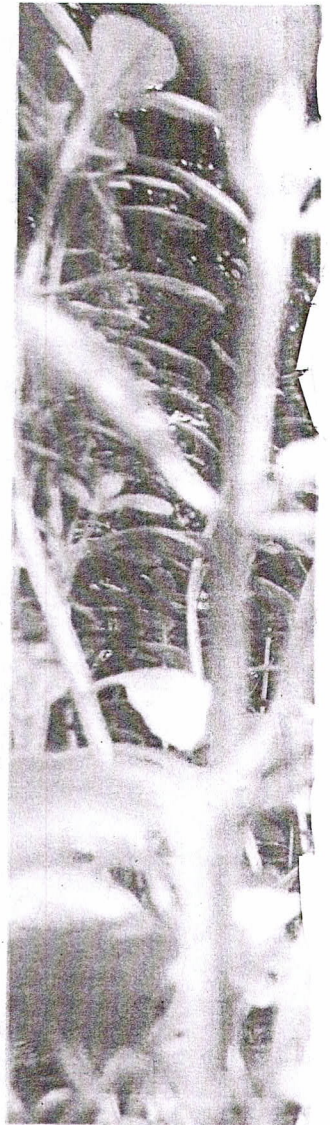
Plantas usadas para remédios da rede municipal são do Horto da Prefeitura

A produção de medicamentos que tanto cresceu em cerca de cinco anos, na cidade,