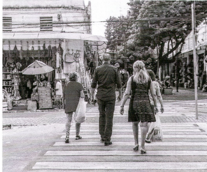
FAIXA ELEVADA para travessia de pedestres está entre as intervenções para melhoria da Segurança Viária