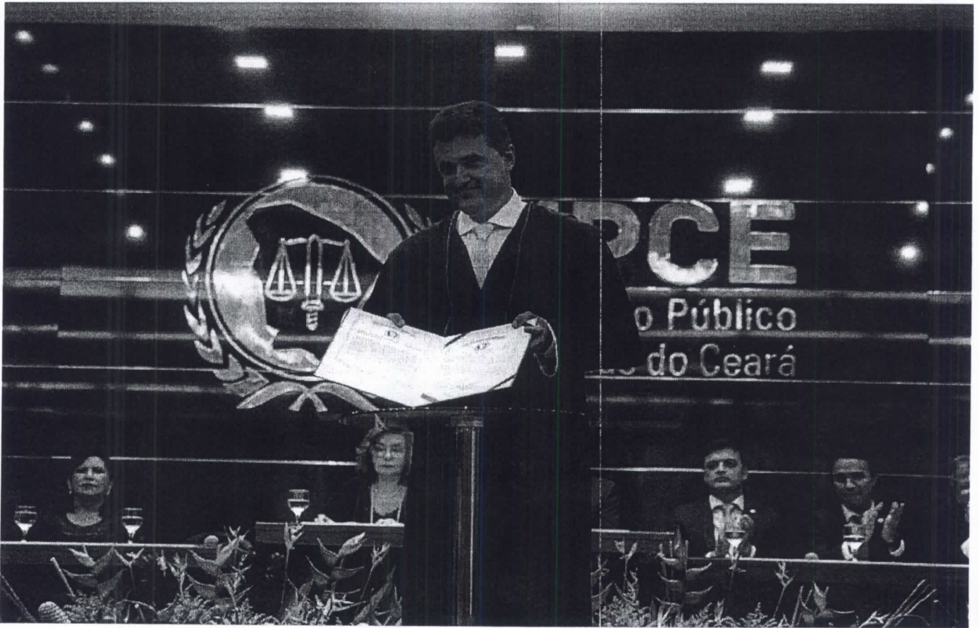
Manuel Pinheiro toma posse como novo procurador-geral de Justiça do Ceará

07/01/2020 09h30 · Atualizado há 22 horas