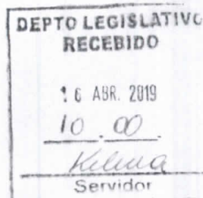
Frota Cavalcante Vereador – PODEMOS

DEPARTAMENTO LEGISLATIVO DA CÂMARA MUNICIPAL DE FORTALEZA, 16 DE Abril DE 2019.