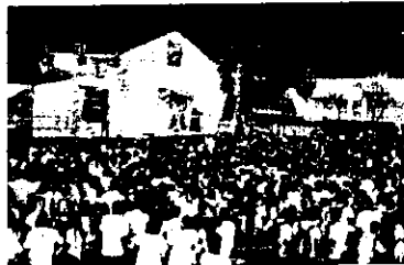
(polopoly_fs/1.1813615/image/image.jpg) No evento, foram anunciados e premiados os vencedores de oito expressões de arte.

21:44 - 31.08.2017 / atualizado às 22:31