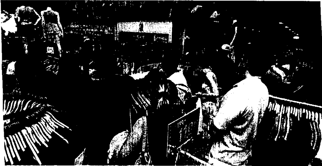
que se refere à receita nominal, o comércio varejista cearense registrou crescimento de 11,1%, enquanto o País evoluiu 8,5%, no acumulado do ano