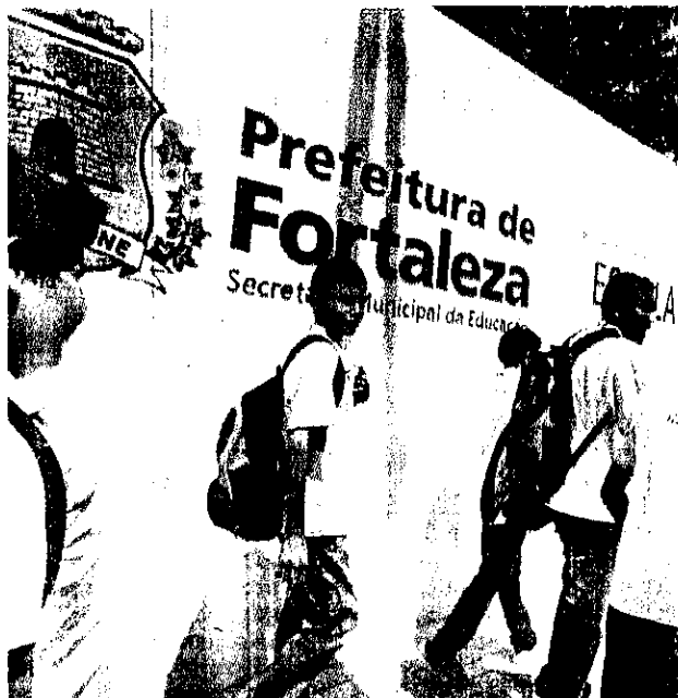
A campanha, em fase de testes, objetiva promover a habilidade de vida, informar sobre as drogas e cultivar o pensamento crítico dos alunos.

O Unplugged traz um método desenvolvido na Europa, voltado para a promoção de discussões, em linguagem acessível, abordando os assuntos que levam os jovens a consumirem drogas. O programa contempla 12 aulas com jogos, brincadeiras,