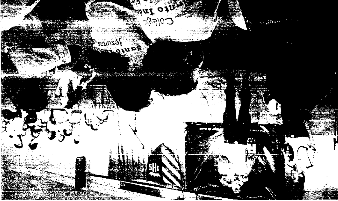
Desde a última segunda-feira, o horário do recreio dos alunos do "Santo Inácio" passou a contar com a presença de policiais. Aos poucos, a iniciativa ganhou o apoio da comunidade escolar.