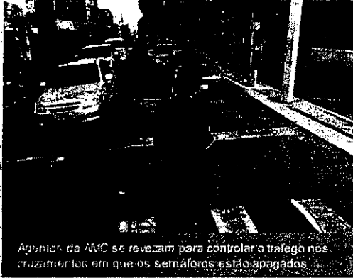
Agentes da AMC se revezam para controlar o tráfego nos cruzamentos em que os semáforos estão apagados