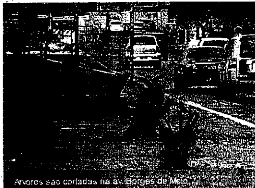
Árvores são cortadas na av. Borges de Melo

Cerca de 14 árvores , localizadas no canteiro central da avenida Borges de Melo, próximo à Polícia Rodoviária Federal (PRF), foram cortadas. O corte foi provocado por conta das obras do Veículo Leve sobre Trilhos (VLT) , que estão sendo realizadas no local, de acordo com a Secretaria da Infraestrutura do Estado (Seinfra).