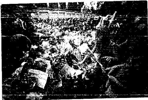
Do lado de fora da casa de Mandela, centenas de pessoas deixaram flores e presentes para o líder

Os sul-africanos foram a igrejas, mesquitas, templos e sinagogas de todo o país, no primeiro domingo desde a morte de Nelson Mandela. "Que seu longo caminho em direção à liberdade seja apreciado e realizado por todos nós", disse o arcebispo da Cidade do Cabo, Thabo Mokgoba, referindo-se ao primeiro presidente negro da África do Sul, que morreu na última quinta-feira, aos 95 anos, em Johannesburg.