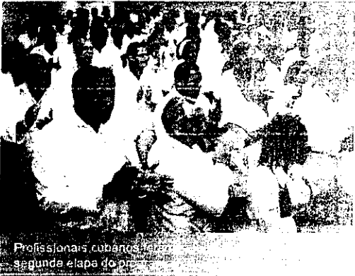
Profissionais cubanos na segunda etapa do programa

Oficiam vai receber mais médicos cubanos selecionados durante a etapa final do programa Mais Médicos. 85 municípios cearenses receberam os profissionais. De acordo com Ministério da Saúde, o Estado fluminense recebeu a maior quantidade de médicos (233), quanto ao número de médicos escolhidos.