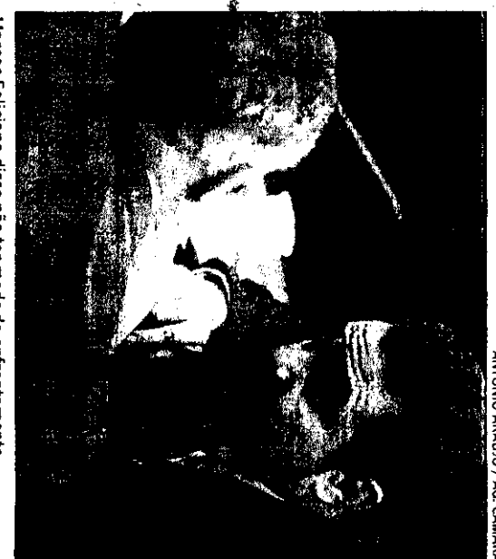
Marcos Feliciano disse não ter medo do enfrentamento

pendentes destes, tendo direito, por exemplo, a receber pensão. O parecer contrário não significa o arquivamento do projeto, mas obrigará o plenário a debater-se sobre o tema caso deseje aprová-lo. O ataque ao movimento LGBT foi preparado com a bancada evangélica para levar adiante todas as matérias antes do encerramento do mandato de Feliciano, em fevereiro do ano que vem. A expectativa da comissão é de que haverá no máximo mais uma reunião de votação até o fim do ano. "Meu papel é colocar para votar. Não tenho medo do enfrentamento, não tenho medo do que escreve