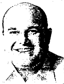
Roberto Cláudio Prefeito de Fortaleza

"A Fortaleza Liquida é uma grande festa para o comércio fortalezense. Essa concentração de esforços para dinamizar um dos principais setores que sustentam a nossa economia tem sido muito exitosa. Toda ação que empreenda criatividade, esforço conjunto e uma prática cujos resultados são benéficos para todos será sempre bem-vinda. Como Prefeito desta cidade, presto meu apoio à CDL de Fortaleza e me alegro em saber que a Fortaleza Liquida será ainda maior para corresponder às expectativas de todos que participarem dessa megapromoção."