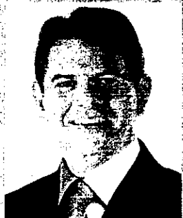
Cid Ferreira Gomes Governador do Estado do Ceará

"A Fortaleza Liquida é uma grande festa para o comércio fortalezense. Essa concentração de esforços para dinamizar um dos principais setores que sustentam a nossa economia tem sido muito exitosa. Toda ação que empreenda criatividade, esforço conjunto e uma prática cujos resultados são benéficos para todos será sempre bem-vinda. Como Prefeito desta cidade, presto meu apoio à CDL de Fortaleza e me alegro em saber que a Fortaleza Liquida será ainda maior para corresponder às expectativas de todos que participarem dessa megapromoção."