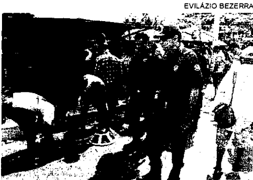
Guardas municipais participaram da fiscalização ontem na Feira da Parangaba

Quatorze fiscais, 12 agentes de trânsito e 12 guardas municipais tentaram impedir, ontem, que o espaço público próximo à Feira da Parangaba se transformasse em estacionamento ou em ponto dos feirantes