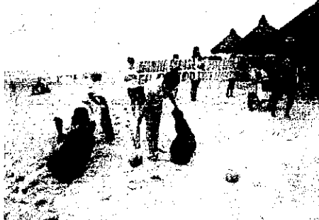
Enquanto caminhavam pelas barracas, os jovens recolhiam o lixo jogado no local e distribuíam panfletos aos banhistas

Da sala de aula para as praias de Fortaleza. Cerca de 50 estudantes fizeram, neste domingo, uma ação para conscientizar a população e os turistas da Praia do Futuro com relação à sustentabilidade e à limpeza da orla. Enquanto caminhavam pelas barracas, os jovens recolhiam o lixo jogado no local.