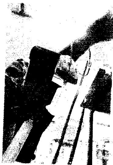
Também será obrigatório o Teste de Ácido Nucleico em bolsas de sangue coletadas pelo País

No ano passado, Alexandre Padilha diminuiu de 18 anos para 16 anos a idade mínima para a doação de sangue. Com as idades mínima e máxima para doação ampliadas, 8,7 milhões novos voluntários pode-